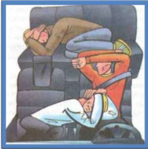
Позы водителя и пассажиров при неизбежности столкновения